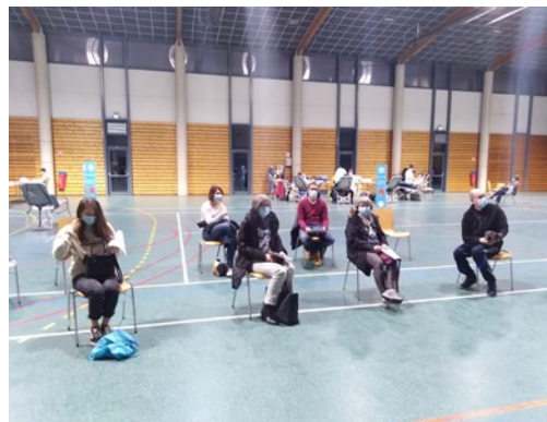
Avant l'inscription des donateurs de sang

Un questionnaire destiné à l'entretien préalable vous est donné. Il est à compléter avec votre stylo. Sinon, l'EFS fournit un stylo qui sera à rendre au docteur lors de l'entretien médical et qui sera ensuite désinfecté.